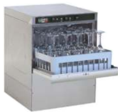
HSP 4 / HSP 4A / *DP40PSPD