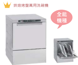
SP 68 E